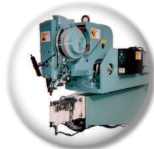
ワッシャー供給機付リベットセッター