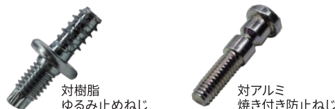
対樹脂 ゆるみ止めねじ

当社が得意とする機能性ねじや塗布剤を、課題に合わせて加えることが可能です。ゆるみ止めやコンタミ対策をはじめ、締結条件に最適な機能を付与します。