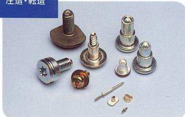
精密加工 タップタイト形状 トルクス形状 中空形状