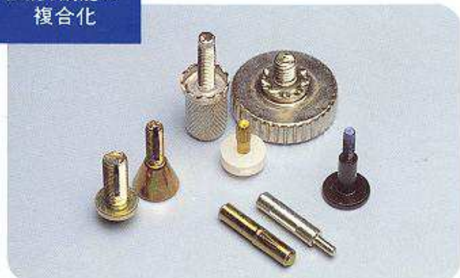
溝付形状 樹脂インサート 接着剤塗布 座金組込み