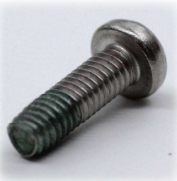
日東精工製高機能ねじ

また、プレス品やダイキャスト製品など、世界中の日東精工グループ会社の製品あるいは調達品も輸入販売しています。