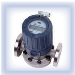
日東精工製流量計