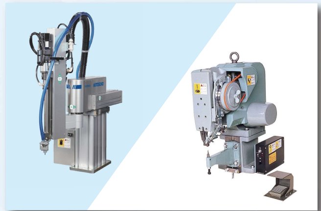
日東精工製ねじ締めロボット