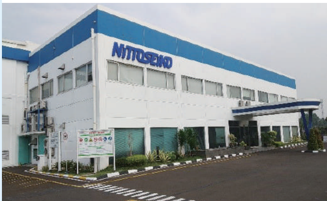
(上) INT本社 (下) ブカシ営業所