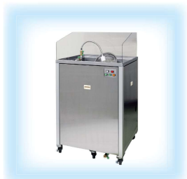
日東精工製マイクロバブル洗浄機