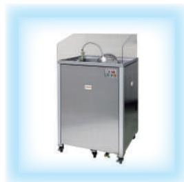
日東精工製マイクロバブル洗浄機