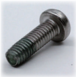
日東精工製高機能ねじ

また、プレス品やダイキャスト製品など、世界中の日東精工グループ会社の製品あるいは調達品も輸入販売しています。