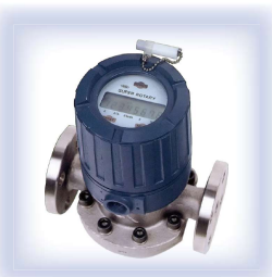
日東精工製流量計