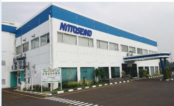
(上) INT 本社 (下) ブカシ営業所