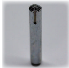
日東精工製締結ピン