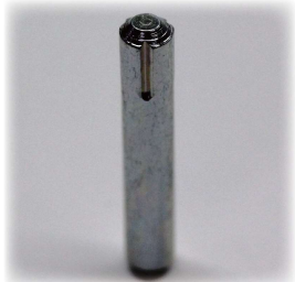
日東精工製締結ピン