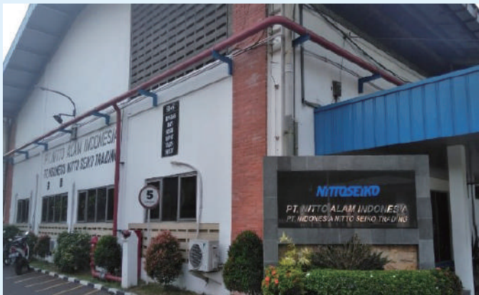
PT. INDONESIA NITTOSEIKO TRADING