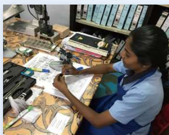
検査工程：リングゲージの校正中