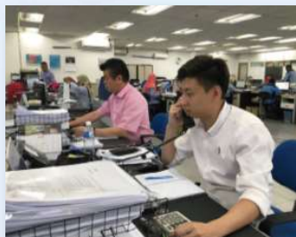
セールス部門：取引先との商談中