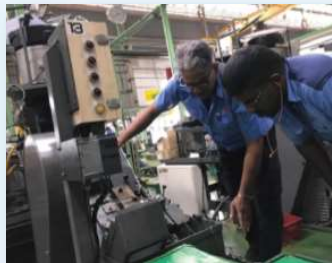
転造工程：部下への指導風景