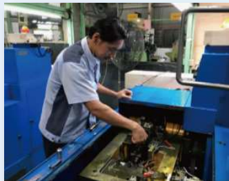
圧造工程：日東精工製ヘッダー機にて段取り中

MPMはファスナー製品製造トップメーカーである日東精工株式会社と、グローバルに販売拠点がある株式会社テクノアソシエとの合併会社であります。その両社の優位点を融合することで、他社にない提案力とサポート体制を備えた会社であります。私たちは、日東精工のポリシーであります『お客様にトータルファスニング・ソリューションを提供する』を、このマレーシアでも実現出来るよう活動しております。