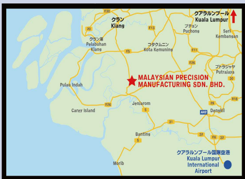
(上) 会社外観 (下) 所在地図