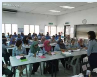
日本語教育の風景