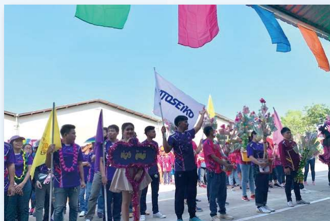
スポーツディにて