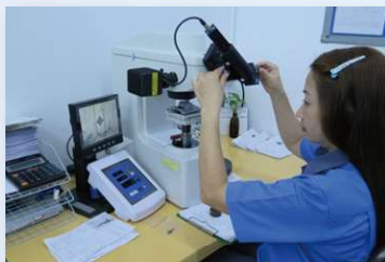
充実した検査設備で高い品質を