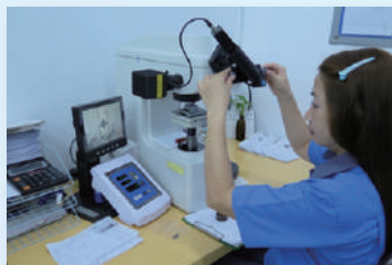
充実した検査設備で高い品質を