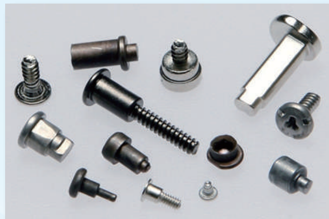
内製品（特殊ねじ、ピン、リベット）

「日本と同じ品質の製品を現地で供給をしていく」を基本理念に、創業当初から熱処理や表面処理といった特殊工程を社内に取り入れ、一貫生産によるモノづくりで、生産ノウハウと技術力を育ててまいりました。タイでは自動車業界を中心としたあらゆる分野のお客様に技術提案をすることで、安心・安全な製品の供給体制を整えています。