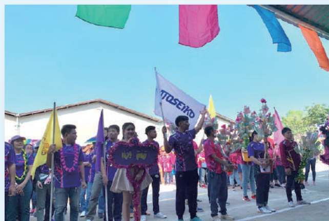
スポーツディにて