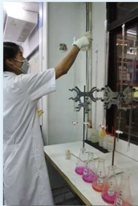
環境に配慮したものづくりを