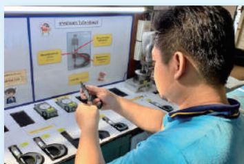
5Sの徹底で日本の製品と同じ品質を