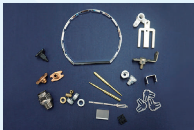
購入品販売（日東グループの調達網を生かした製品）