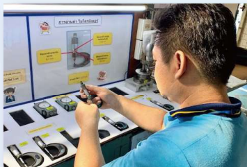
5Sの徹底で日本の製品と同じ品質を