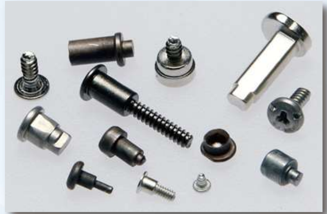
内製品（特殊ねじ、ピン、リベット）

「日本と同じ品質の製品を現地で供給をしていく」を基本理念に、創業当初から熱処理や表面処理といった特殊工程を社内に取り入れ、一貫生産によるモノづくりで、生産ノウハウと技術力を育ててまいりました。タイでは自動車業界を中心としたあらゆる分野のお客様に技術提案をすることで、安心・安全な製品の供給体制を整えています。