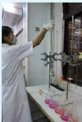
環境に配慮したものづくりを