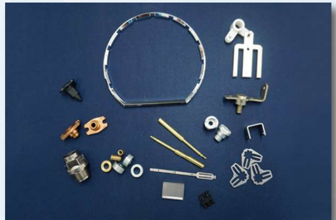
購入品販売（日東グループの調達網を生かした製品）