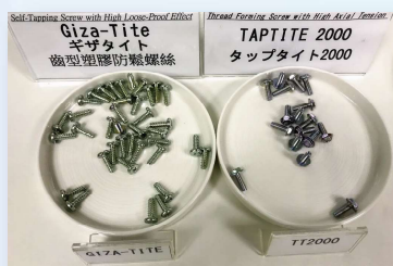
ギザタイト®、タップタイト®2000

ねじからねじ締め機、計測検査装置まで、3つの事業が持つ中核技術を組み合わせ融合を図るとともに、日東精工グループ企業と連携しつつ『Fastening Solution』の実践を行い、従来の日系市場のみならず、更なる市場拡大を狙っています。