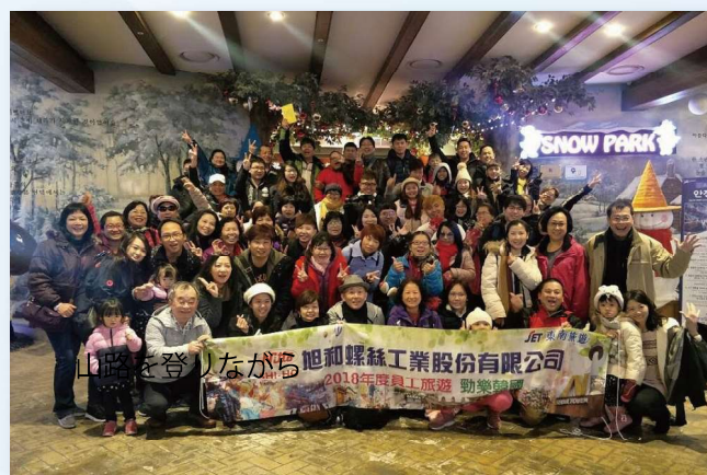
韓国・仁川への社員旅行