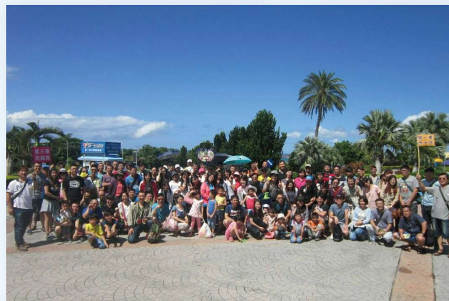
夏の日帰りバス旅行