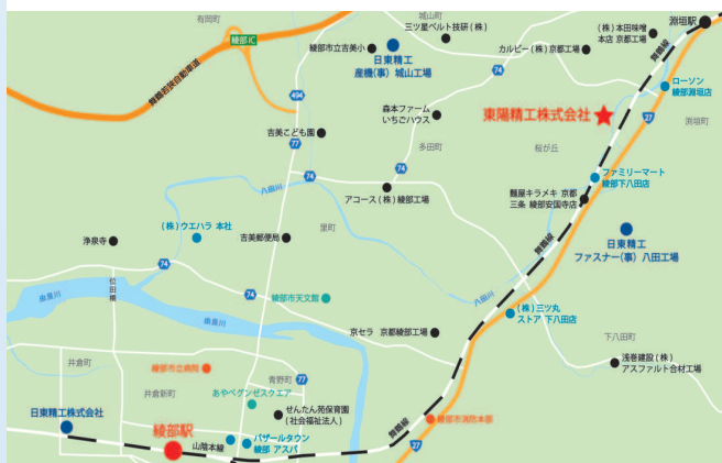
(上) 会社外観 (下) 所在地図