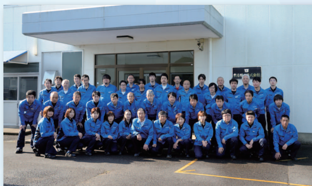
従業員の集合写真