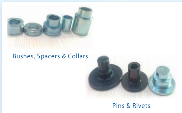
Bushes, Spacers & Collars