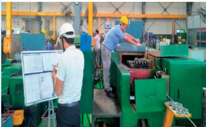
(上) 会社外観 (下) 工場内風景